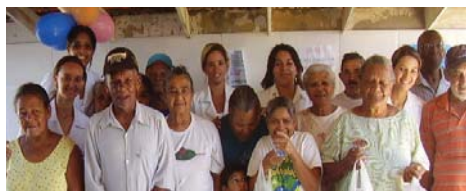
Acadêmicas do 7º Período de Enfermagem e Pacientes

Acadêmicas do 7º período de Enfermagem (FASEH).