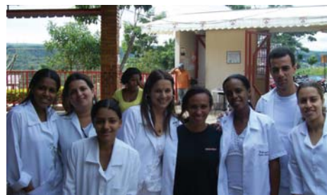
Acadêmicos de Enfermagem e Monitora do SESI ao centro

Durante o evento, os participantes, sob a orientação das acadêmicas, além de terem feito os exercícios físicos mencionados, foram orientados quanto à importância da ingestão de líquidos e da hidratação da pele. Além disso, tiveram a pressão arte-