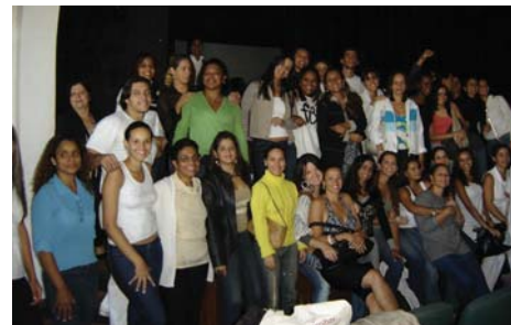
Professores e Acadêmicos do Curso de Enfermagem