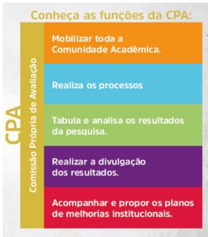
Figura 3 – Funções CPA