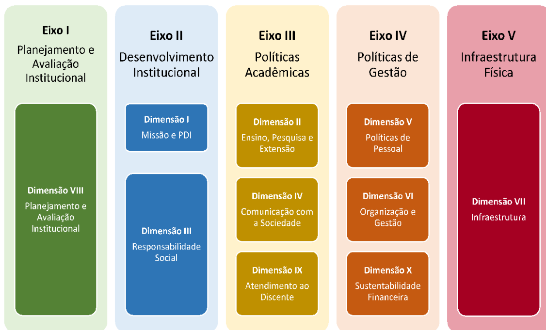
Figura 2 – Eixos e dimensões do SINAES